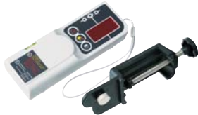
TL-RE / TL-RC