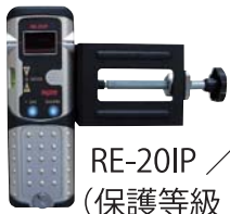
RE-20IP / RC-2 (保護等級：IP54)